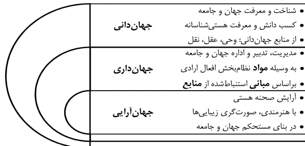
شکل ۲: مدل پیوستگی و سلسله‌مراتب جهان‌دانی، جهان‌داری و جهان‌آرایی

حق‌محوری در تدبیر نظام اجتماعی با سه عنصر مهم جهان‌دانی، جهان‌داری و جهان‌آرایی سامان می‌پذیرد، به طوری که هر لاحق، مرهون سابق و هر سابق، پایه لاحق خواهد بود (جوادی آملی، ۱۳۹۱، ص ۴۱). از نظر ایشان، به‌کارگیری هنر (جهان‌آرایی) مسبوق به اتقان بنا و استحکام ساختارهای اساسی جامعه است و این مهم را فن شریف جهان‌داری اداره می‌کند و تدبیر و مدیریت هر ساحتی، فرع معرفت هستی‌شناسانه آن عرصه است که فن عریق جهان‌دانی کفیل آن است. در شکل شماره ۲ مدلی ترسیم شده که پیوستگی و سلسله‌مراتبی بودن این سه عرصه مهم را نشان می‌دهد.