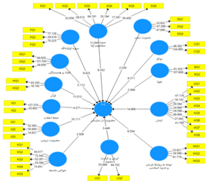
شکل ۳: مدل پژوهش در حالت معناداری ضرایب استاندارد